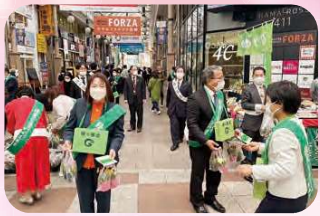
3月15日 緑の募金へのご協力お願い