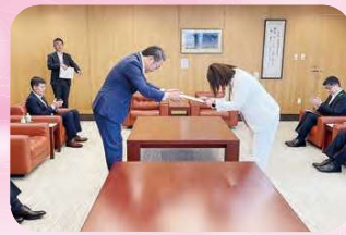
5月11日 監査委員 就任