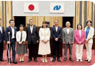
7月6日 改革21のみなさん