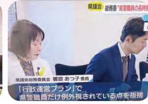
6月22日 総務委員会での質問が報道されました