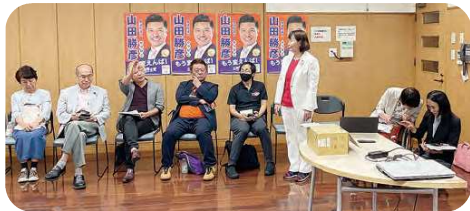
7月1日 オーガニック給食無償化と子育て支援 座談会