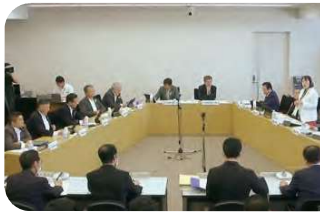
6月22日 総務委員会 警察本部