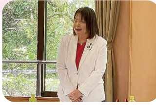
5月20日 長与南地区コミュニティ連絡協議会総会