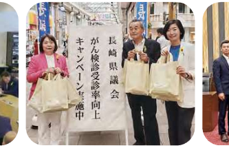
6月23日 がん検診受診率向上キャンペーン