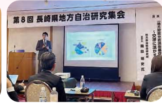
6月3日 地方財政分析講座基礎編