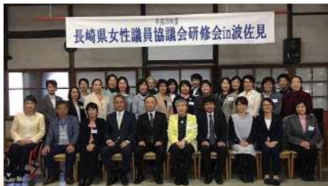
長崎県女性議員協議会研修会in波佐見