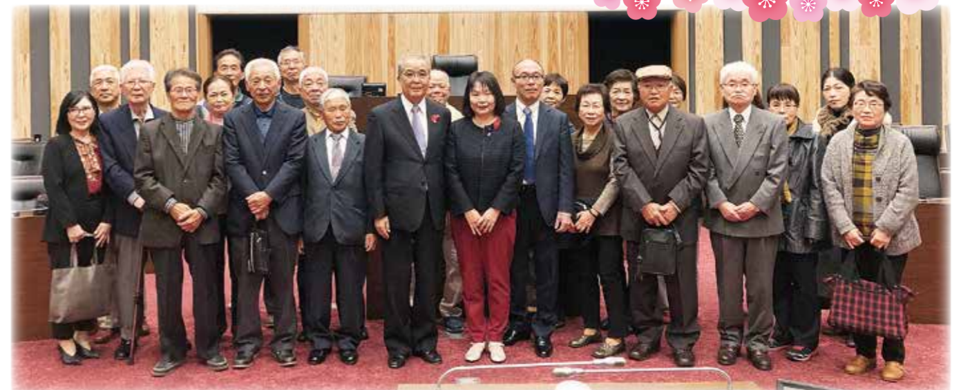
12月5日 県議会初めての登壇(中村県知事と)

今年も県民の皆様の声を県政に届け、誰もが笑顔で暮らせる長崎県となりまますように、誠心誠意、頑張ってまいりますので、皆様の一層のご支援、ご協力を賜りますようお願い申し上げます。