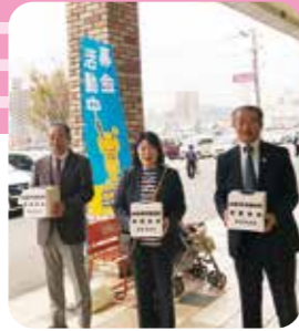
11月3日 台風19号被災地支援募金活動