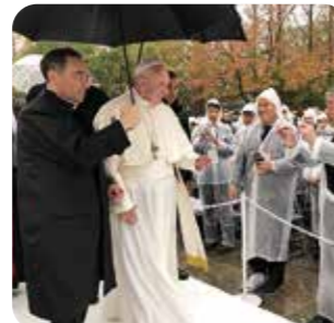
11月24日 ローマ教皇 来県