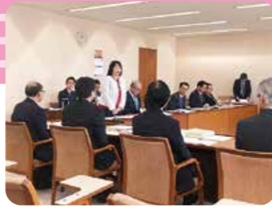
11月7日 議会運営委員会視察 宮城県議会