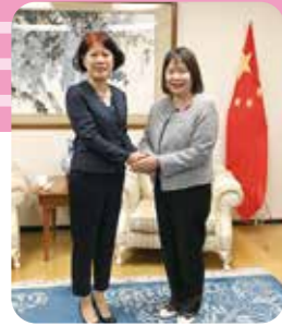
10月23日 劉亜明総領事へ活動報告