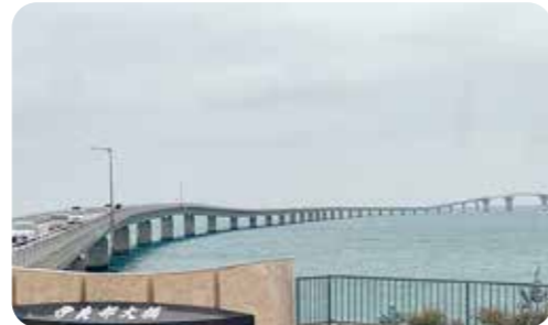
11月20日 環境生活委員会視察 伊良部大橋