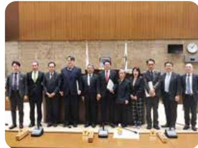
11月8日 議会運営委員会視察 青森県議会