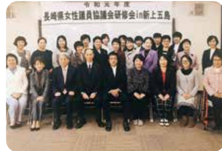
11月15日 女性議員協議会研修会