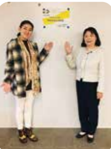
11月23日 イベント 産業カウンセラーの日