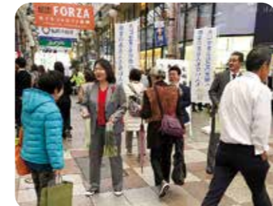
11月27日 「障害がある人もない人も ともに生きる社会を実現するための」 街頭キャンペーン