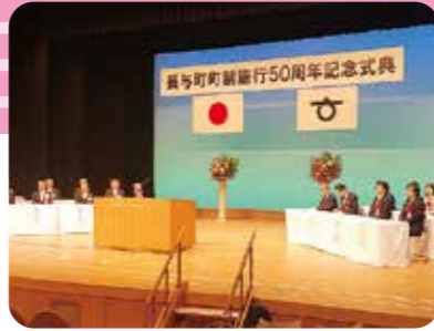
11月3日 長与町文化祭表彰式