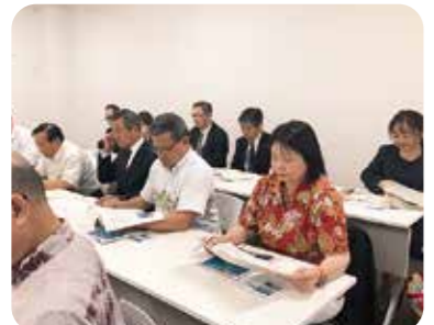
11月20日 環境生活委員会視察 宮古島 下地島空港