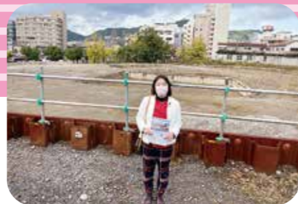
11月11日 総務委員会視察 県庁地跡地活用