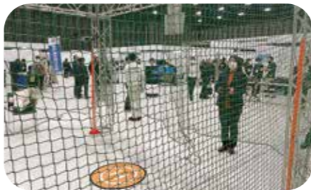
12月25日 県政150周年 「ながさきICTフェア2021」 ドローン体験