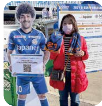
11月28日 V・ツアーレン長崎 応援!!