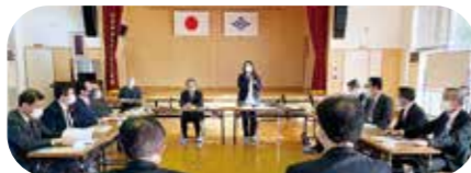
11月18日 観光・IR・新幹線対策 特別委員会視察