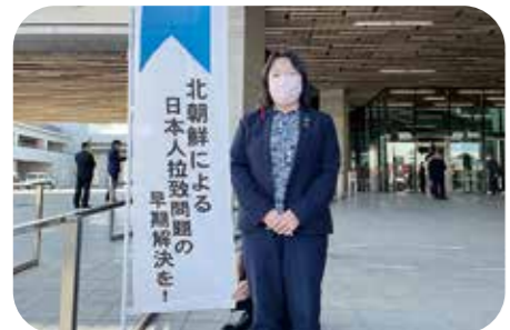
12月10日 北朝鮮による拉致問題の 早期解決を!