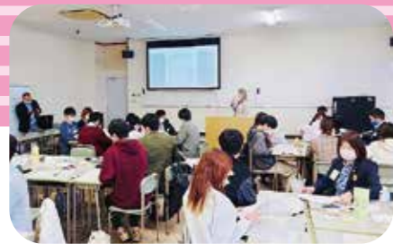
11月9日 長崎県立大学 「政治・経済分野における 男女共同参画」