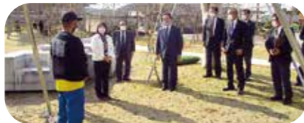
11月18日 波佐見町公園「HIROPPA」