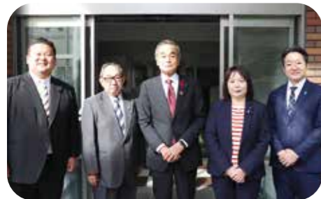
11月16日 長崎大学BSL-4視察