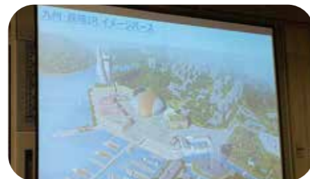
12月20日 九州IRシンポジウム