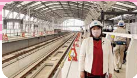
11月11日 総務委員会視察 九州新幹線 長崎駅